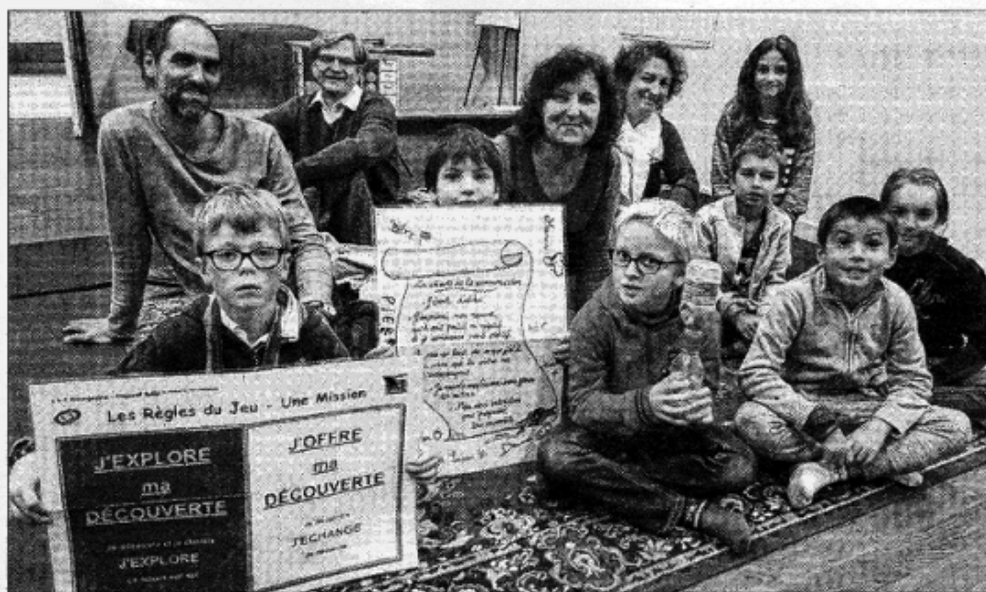
Des élèves de primaire ont découvert une nouvelle méthode d'apprentissage durant les vacances scolaires.

La semaine dernière, pour la première fois, Initiative et formation Bourgogne a ouvert ses ateliers à sept élèves de primaire. Les intervenants étaient Claude Ber-